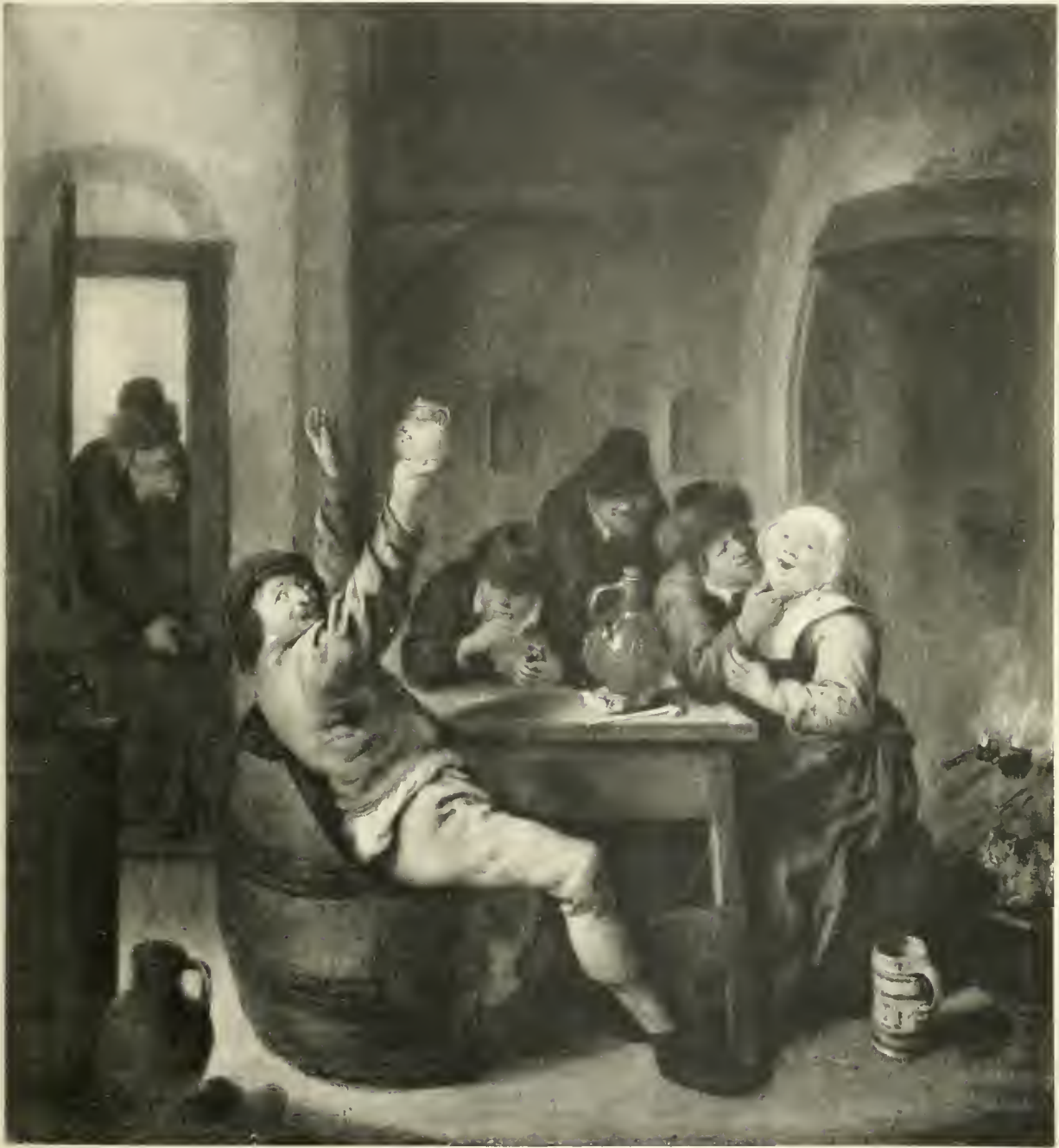
J. M. MOLENAER

TERCENTENAIRE DE REMBPANDT - EXPOSITION FREDERIK MULLER & CIE.